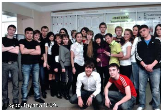
I курс. Группа №19.

Представляем вашему вниманию рейтинг всех групп.