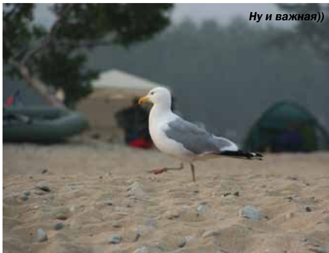
Ну и важная))