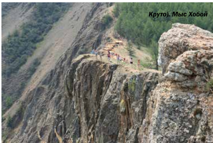
Круто). Мыс Хобой