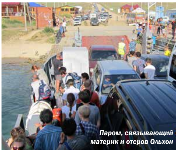
Паром, связывающий материк и остров Ольхон

28 июля в 10.10 мы очутились в замечательном городе Восточной Сибири – Иркутске. Здесь купили основные продукты на весь период похода, остальное решили приобретать по ходу, заходя в деревеньки. Иркутск оказался городом старше Оренбурга – он был основан в 1661 году и мог похвалиться богатой историей. Центральная улица Иркутска – 130-й квартал – украшена внушающим уважением символом города – Бабром (якут. – тигр), держащим в зубах соболя. В Иркутске еще можно взглянуть на площадь пяти церквей и две набережные, одна из которых верхняя, а другая нижняя, но обе интересные и неповторимые.