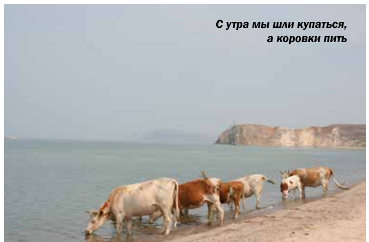
С утра мы шли купаться, а коровки пить